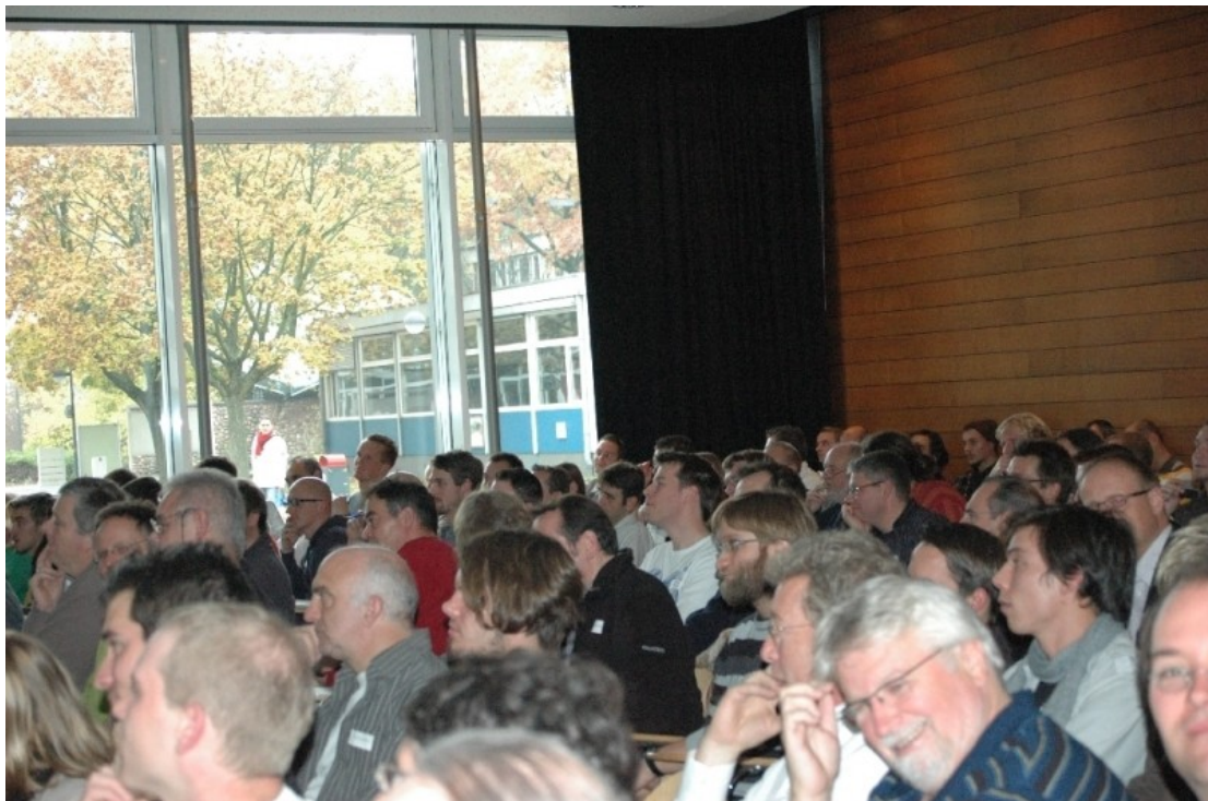
Das Plenum während der Eröffnung des Fachtages

Dass der Einladung zum Fachtag ganze zehn Fachschullehrerinnen und –lehrer folgten, führte dazu dass wir im Dialog mit den Fachschullehrerinnen und –lehrern den Workshop 18.: „Viele Lehrerinnen – und wenige Männer oder wenige Männer – und viele Frauen“ und das Fachschulplenum mit dem Thema „Konsequenzen und Perspektiven des Fachtages für die Fachschule“ nicht durchgeführt haben. Der Nachfolgeveranstaltung des Fachtages können wir die Durchführung dieses besonderen „Schwerpunktes“ nicht empfehlen.